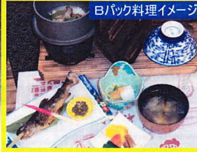
Bパック料理イメージ