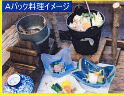
Aパック料理イメージ