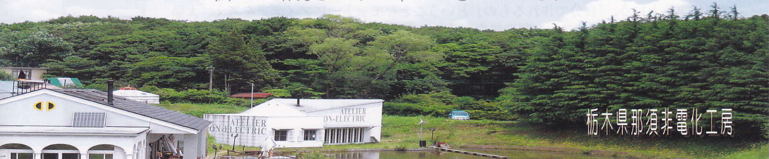
栃木県那須非電化工房