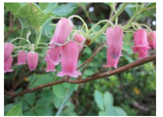
ウラジロヨウラクツジ