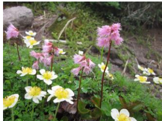
チングルマとイワカガミ