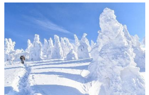
日本三大樹氷 森吉山の樹氷