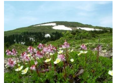
花の百名山 森吉山