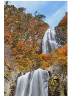
安の滝 (中ノ又溪谷)