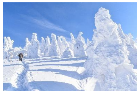
日本三大樹氷 森吉山の樹氷