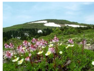
花の百名山 森吉山