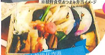
大館能代空港 ご利用の方限定！