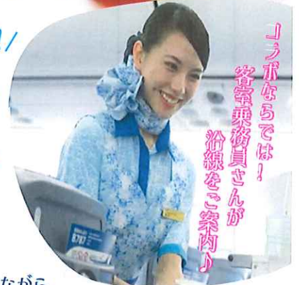
「コラボならではの！ 客室乗務員さんが 沿線をご案内！」

第1弾 2023年11月13日(月)まで 第2弾 2024年1月12日(金)まで