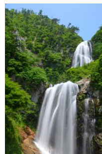
安の滝 (中ノ又溪谷)